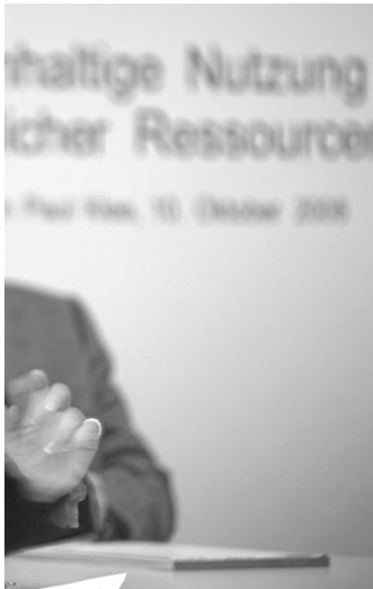
st Teil unserer Strategie.»