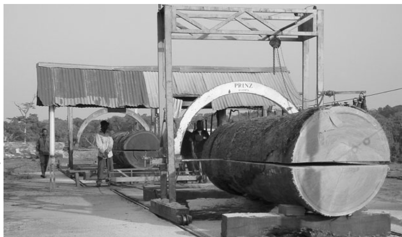
Afrikanischer Wald für Schweizer Fenster: Trotz Label ein Unding.

dings wird sie irreführend verkauft: Das Gütesiegel FSC kann die Regenwälder im Kongobecken nicht retten, das könnte nur eine entschlossene Staatengemeinschaft. FSC ignoriert im Kongobecken die Bedürfnisse der rechtlosen Waldmenschen, der Pygmäen. FSC fördert das Geschäft mit «urwaldfreundlichem» Holz, anstatt es zu reduzieren. Und FSC wirbt in der Schweiz für Türen aus mehreren hundert Jahren alten Urwaldbäumen, anstatt einheimische Alternati-