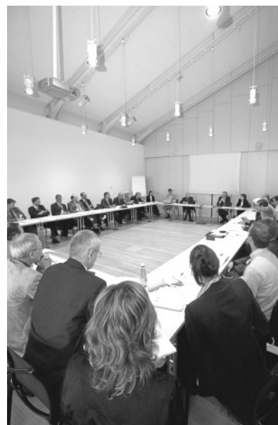
Das Plenum diskutierte, wie viel Markt und wie viel Regulierung es braucht.

Deutlich wurden auch einige Probleme, welche die Wirtschaft bei der Verwirklichung ökologischer Ziele hat. Von mehreren Seiten wurde gefordert, dass Nachhaltigkeit nicht nur bei Produzenten, sondern auch auf dem Markt ein Thema sein müsse. «Wenn sich alle nach dem Motto <Geiz ist geil> auf Easy Jet-Flüge für 30 Franken stürzen, dann ist das ein ökologischer Rückschritt», so eine Votantin. Die Konsumenten müssten also wieder vermehrt für Umweltschutz sensibili-